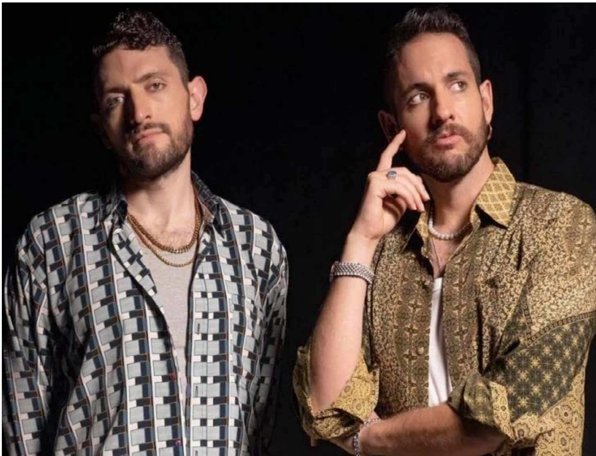
Los Rumberos (México)