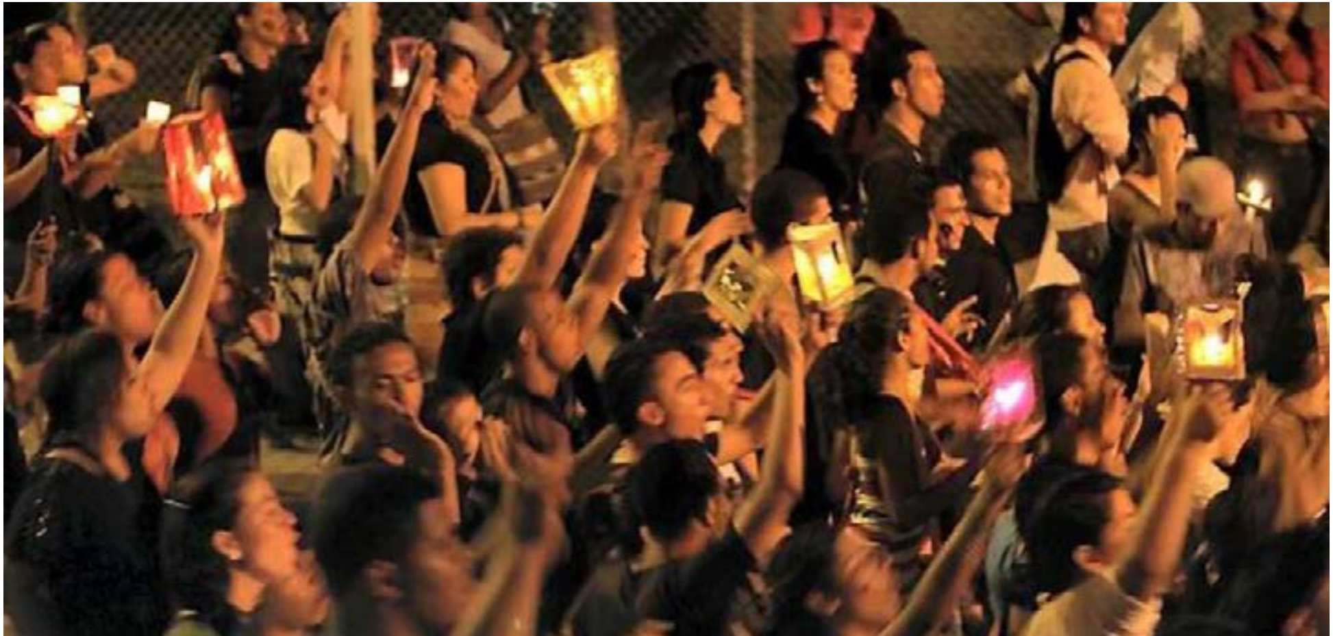
Los estudiantes de Colombia durante más de 30 años han reclamado la gratuidad de la educación pública, por fin fueron escuchados por el actual gobierno

MinEducación Proclama la Gratuidad como Derecho, Beneficiando al 97% de Universitarios Públicos