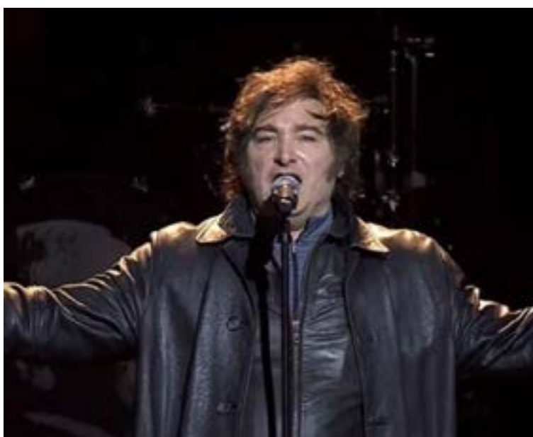
Javier Milei, presidente de Argentina

El peronismo no tiene un líder desde la salida de Carlos Menem en 1999, sino una Liga de Gobernadores y «caciques» provinciales. Históricamente, el peronismo gana si logra la unidad y el adversario («el no peronismo») está dividido.