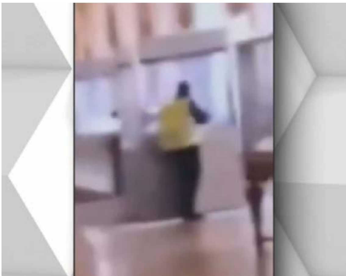
Las primeras imágenes del robo en el Louvre: un ladrón vestido con un chaleco amarillo fuerza una vitrina de la sala Apolo

El golpe, ejecutado con precisión quirúrgica y una audacia que recuerda a los guiones de Hollywood, se consumó en menos de siete minutos. Una banda de al menos cuatro individuos logró acceder al recinto. La