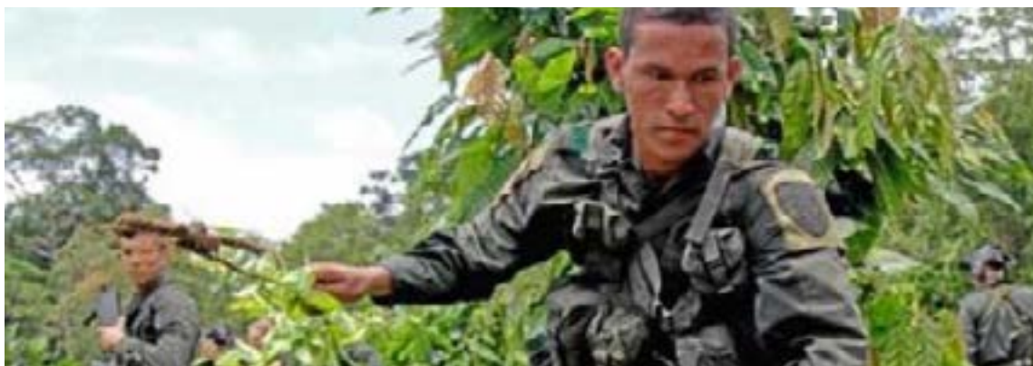
Miembros de la fuerza pública cumplen tareas de erradicación de los cultivos de Coca en el Darién.

El jefe de Estado señaló que la intervención en el