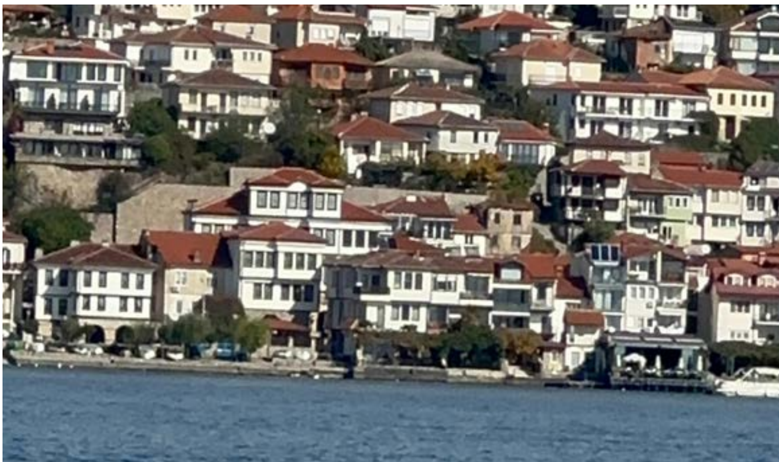
Ohrid, Macedonia del Norte, con casas blancas de techos rojizos que se encaraman densamente sobre una colina. Las edificaciones, de arquitectura tradicional balcánica, descienden hasta la orilla de un gran cuerpo de agua, posiblemente el lago Ohrid, bajo un cielo parcialmente nublado.

Por los valles del Epiro, hacia el silencio