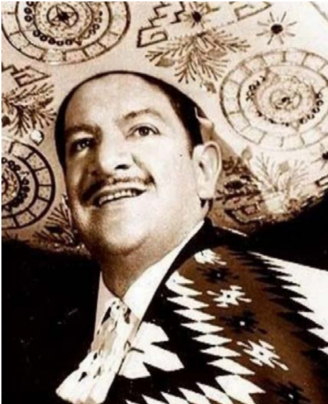
José Alfredo Jiménez. Era cantinero en un sitio visitado por productores y artistas. Hasta que al fin lo escucharon. El resto es historia.

La música es la voz de Dios. Aunque todos la oyen, solo el compositor logra escucharla y convertir cada arpeggio en un sentimiento que se transforma en melodía. A esto se suma el instrumento más bello que posee el ser humano: su voz, el