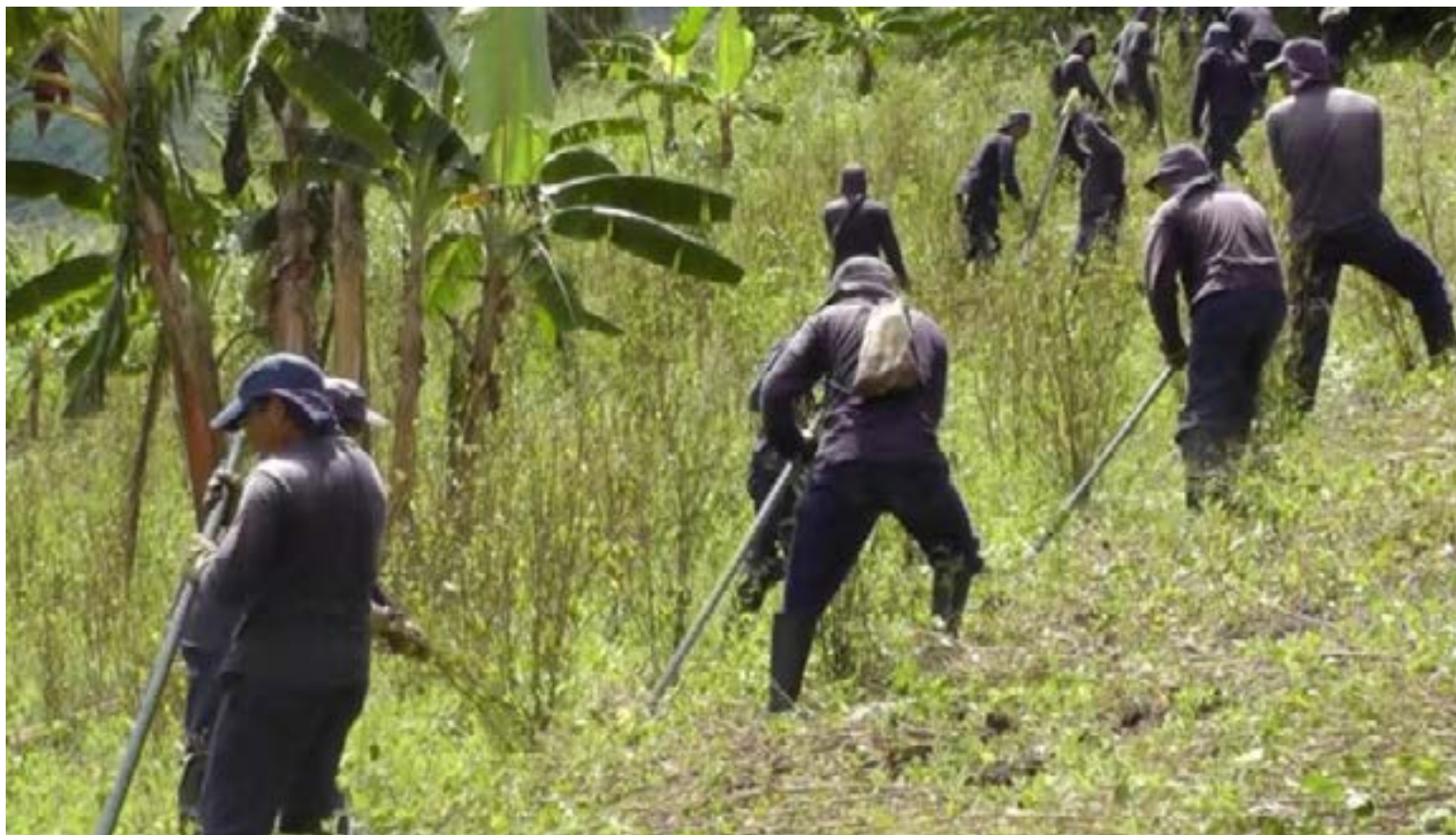
Empezó la erradicación de las matas de coca, que son remplazadas por siembra de cultivos de plátano en el Darién

El presidente Petro subrayó la importancia de la región como corredor estratégico para las economías ilegales: