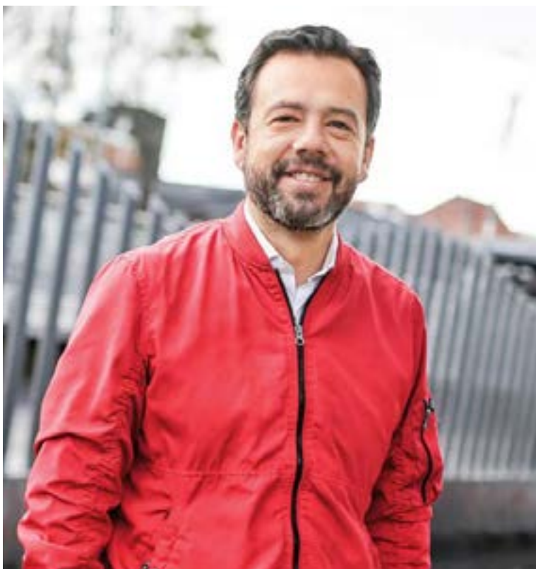
Carlos Fernando Galán, alcalde de Bogotá

E l Consejo Nacional Electoral (CNE) concluyó la audiencia pública de rigor en el marco del proceso de revocatoria contra el alcalde mayor de Bogotá, Carlos Fernando Galán Pachón, dejando en suspenso la continuidad de la iniciativa. Tras la jornada, la autoridad electoral debe ahora deliberar si el expediente CNE-E-DG-2025-024109 procede a la siguiente fase: la recolección de firmas.