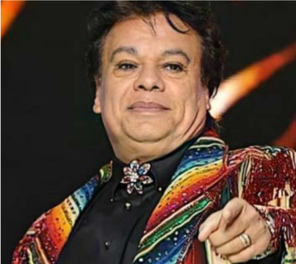
Juan Gabriel. Esperaba todos los días al frente de RCA, para ver si el director escuchaba sus canciones. Comenzó haciendo coros.