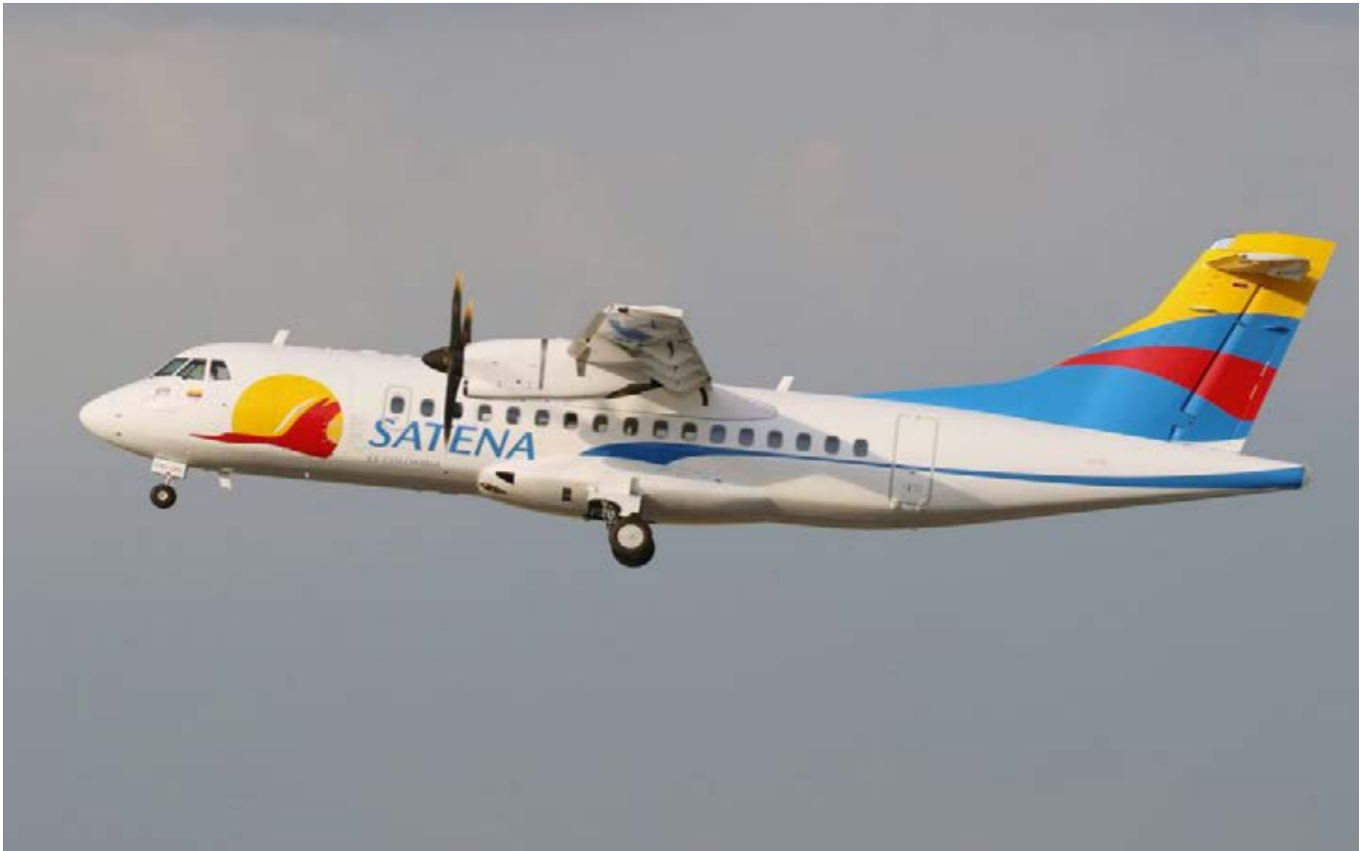
Aviones ATR 42 duplican capacidad de Satena